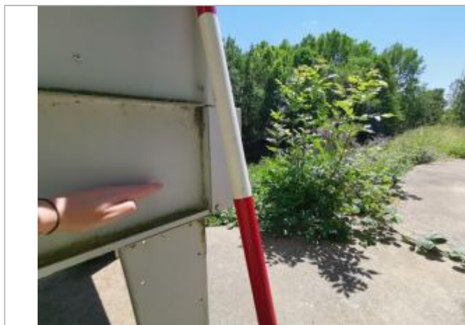
Machine industrielle