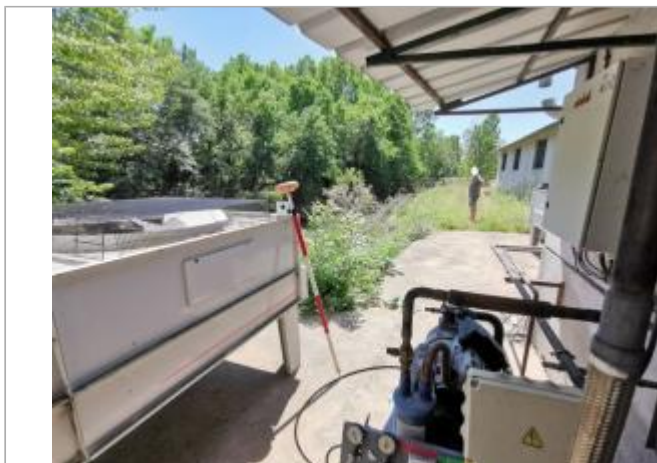
Machine industrielle