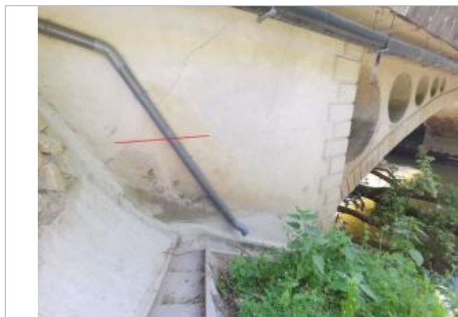
Trace sur parement