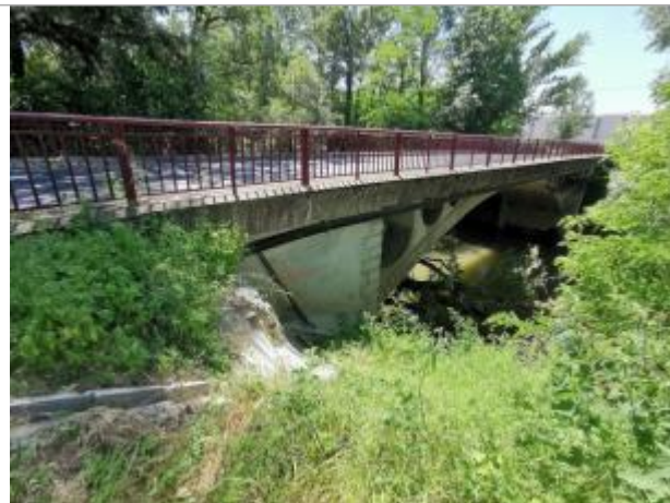
Pont (aval rive droite)