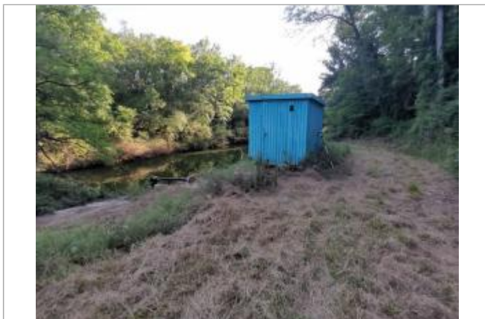
Batiment en tôle