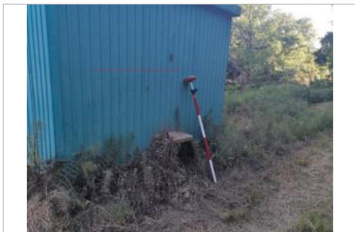
Trace sur le bâtiment - Photo © AGERIN