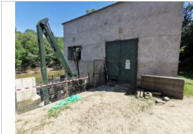
Porte du moulin