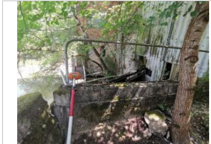
Muret en parpaing - Photo © AGERIN

Coordonnées WGS84 : X: 1.93305088 / Y: 43.76154853