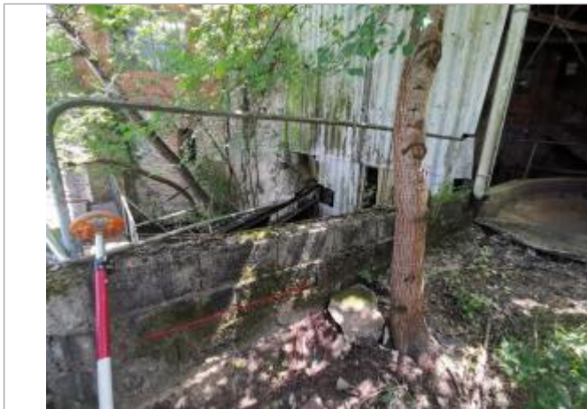
Trace sur le muret - Photo © AGERIN

Altitude calculée de l'eau (en m) : 132.15