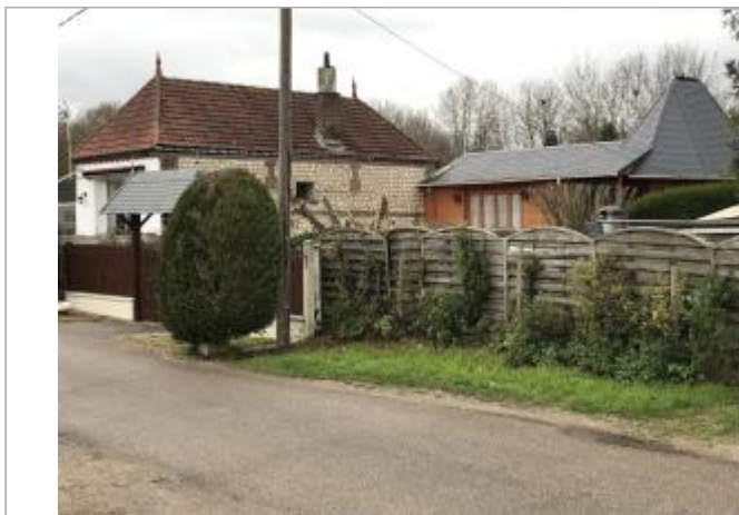
poteau électrique au droit du 254 chemin de halage