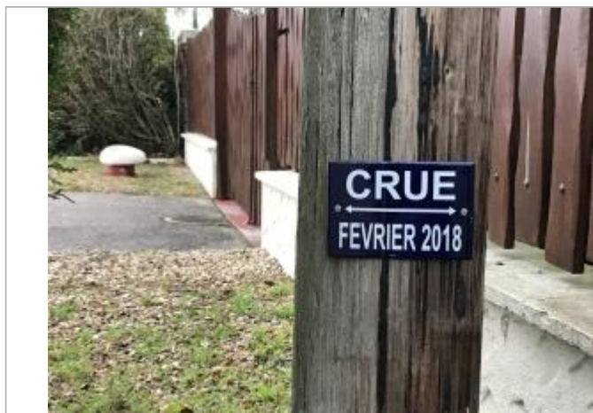
plaque crue fevrier 2018

Texte : crue février 2018 Maximum de l'inondation : Oui Visibilité : Oui État du repère : Bon Pérennité : Longue