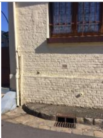
plaque gravée de la crue de janvier 1910 à 77 cm du sol.

Altitude calculée de l'eau (en m) : 5.961 m