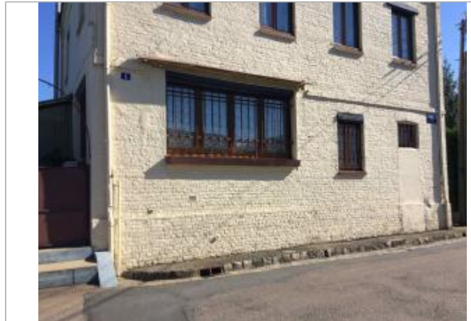
1 rue Gabriel LEMAIRE

Coordonnées WGS84 : X: 1.12281350 / Y: 49.40129600