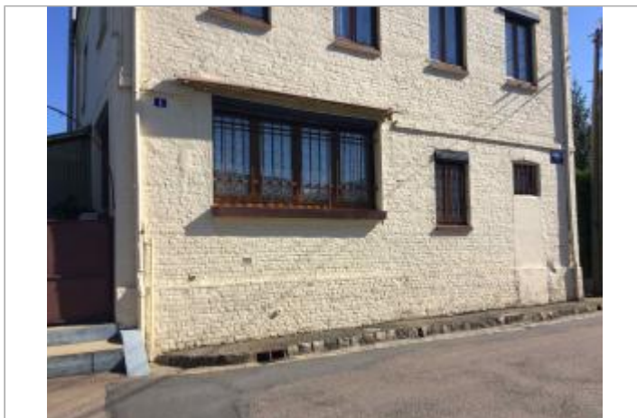
1 rue Gabriel LEMAIRE