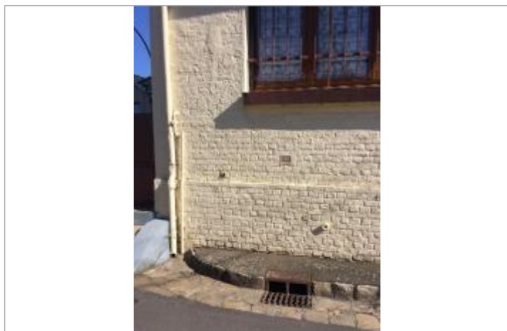
plaque gravée de la crue de janvier 1910 à 77 cm du sol.

Altitude calculée de l'eau (en m) : 5.961