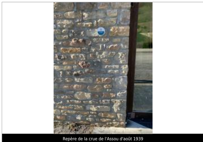
Repère de la crue de l'Assou d'août 1939