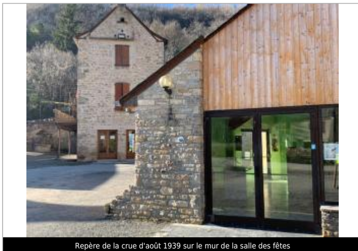
Repère de la crue d'août 1939 sur le mur de la salle des fêtes