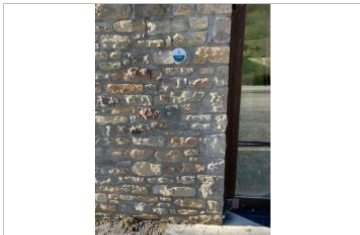
Repère de la crue de l'Assou d'août 1939