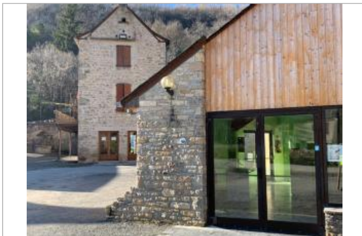
Repère de la crue d'août 1939 sur le mur de la salle des fêtes