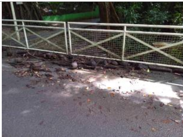
Laisse d'inondation (branches, coco, etc.)