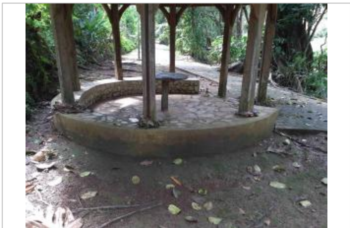
Laisse d'inondation (branchage)

GÉNÉRAL Code : WEB_R_202011301608 Date de mise à jour : 07/07/2023 Auteur : DEAL971