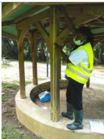
Trace de PHE

Altitude calculée de l'eau (en m) : 4.247 m