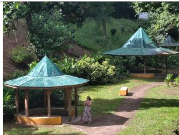
Vue depuis la route