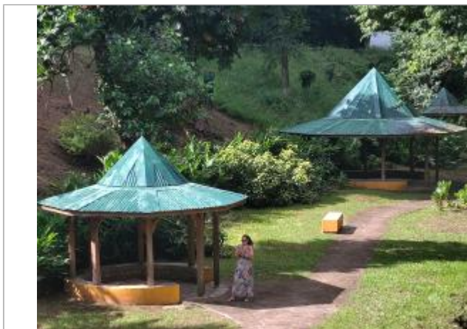
Vue depuis la route

Coordonnées WGS84 : X: -61.47770000 / Y: 16.21810000