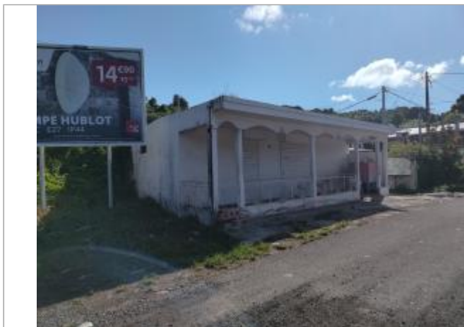
Vue depuis la route

Coordonnées WGS84 : X: -61.47730000 / Y: 16.21360000