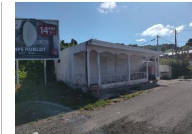
Vue depuis la route