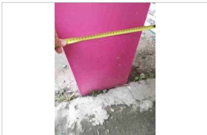
Trace de PHE sur un poteau

Altitude calculée de l'eau (en m) : 2.571 m