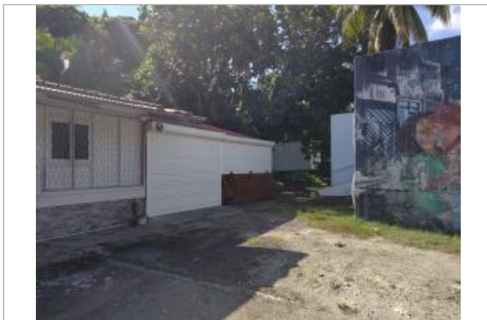
Vue depuis le stade de foot