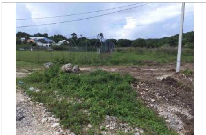
Inondation terrain de football