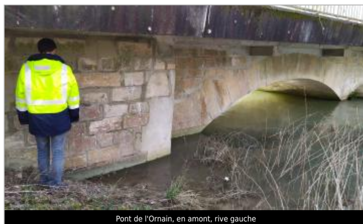
Pont de l'Ornain, en amont, rive gauche

GÉOLOCALISATION Coordonnées WGS84 : X: 4.88761788 / Y: 48.79959020 Coordonnées RGF93 (Lambert 93) : X: 838639.92 / Y: 6857158.44 Coordonnées RGF93 (ETRS89) : X: 4.8876179 / Y: 48.7995902 Code Hydro: F56-0400 Rive de référence: Gauche