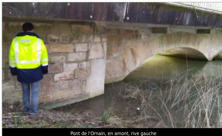
Pont de l'Ornain, en amont, rive gauche