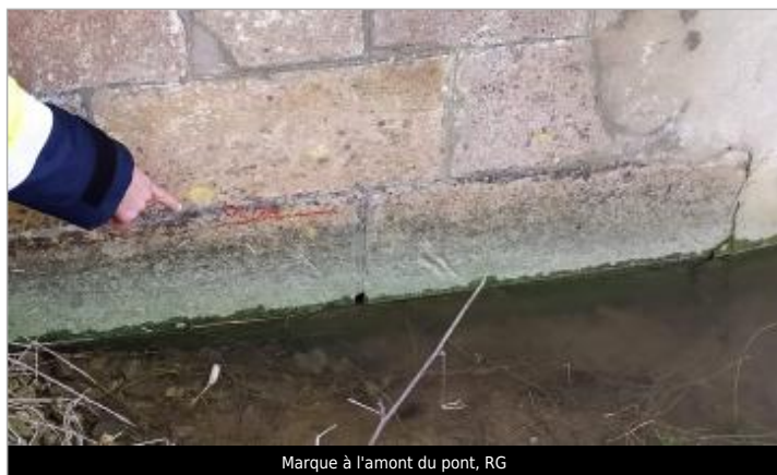
Marque à l'amont du pont, RG

Altitude calculée de l'eau (en m) : 126.11