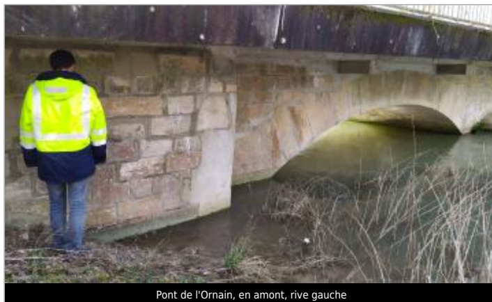
Pont de l'Ornain, en amont, rive gauche