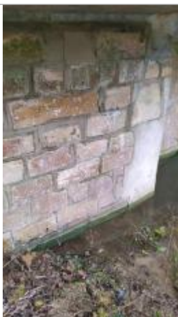
Marque à l'amont du pont, RG

Altitude calculée de l'eau (en m) : 126.1