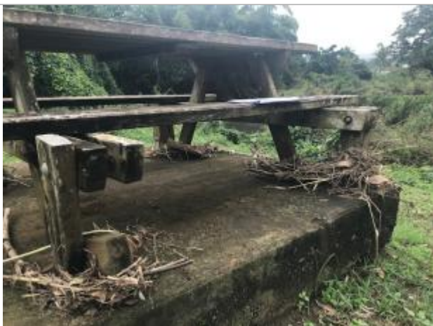
Laisse d'inondation (branche)

Altitude calculée de l'eau (en m) : 3.553 m