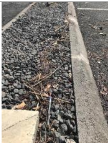
Laisse d'inondation (branches, coco, etc.)