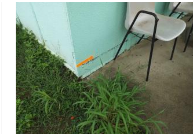
Laisse d'inondation sur mur crépis