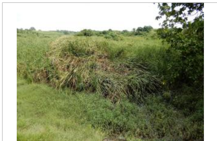
Aplatissement de la végétation au niveau de la zone de stockage de Gaschet

Type de repérage : Campagne de terrain post-inondation Organisme(s) : DEAL Guadeloupe