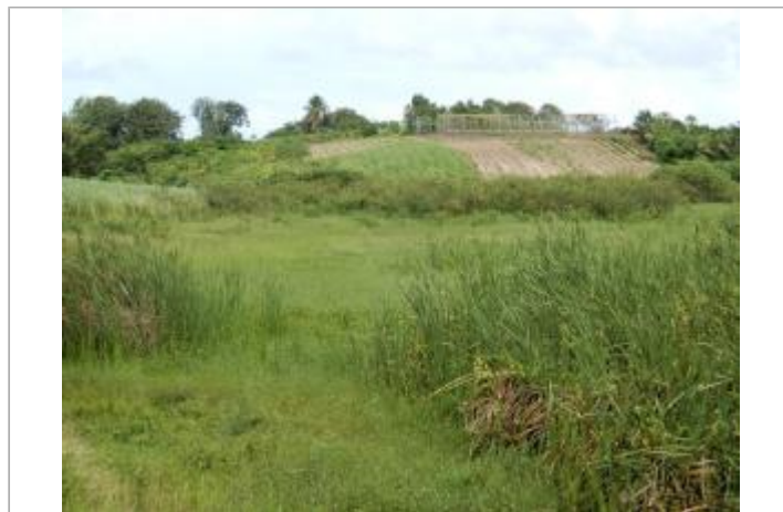
Barrage de Gaschet - zone de stockage