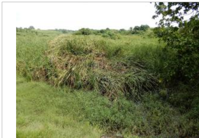
Aplatissement de la végétation au niveau de la zone de stockage de Gaschet

Type de repérage : Campagne de terrain post-inondation Organisme(s) : DEAL Guadeloupe