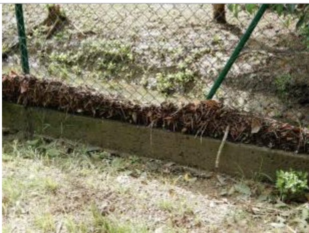
Barrière grillagée avec un dépôt de laisse de 40cm

Altitude calculée de l'eau (en m) : 1.908 m