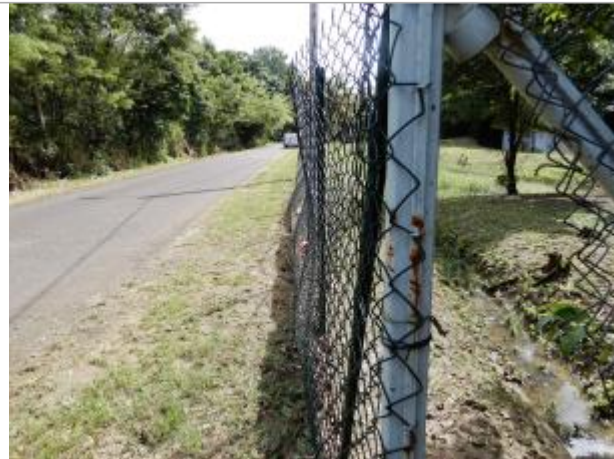
Extension du parc paysager de Petit-Canal, lieu-dit Groupio - accessible depuis l'espace public