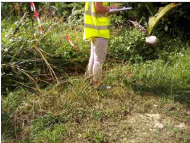
Végétation aplatie témoignant d'une inondation en bordure de voirie