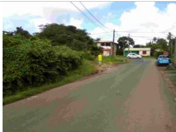
Inondation à l'intersection de la N5 et de la route de Saint-Girond