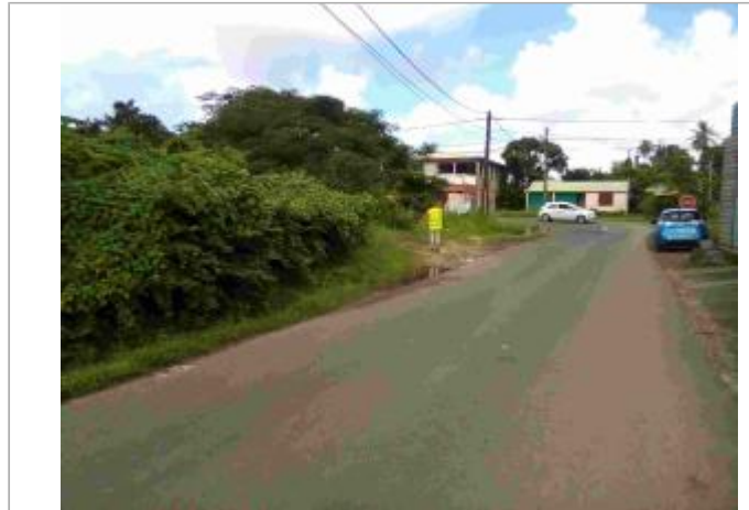
Inondation à l'intersection de la N5 et de la route de Saint-Girond