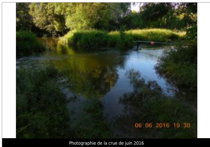
Photographie de la crue de juin 2016

Altitude calculée de l'eau (en m) : 110.635 m