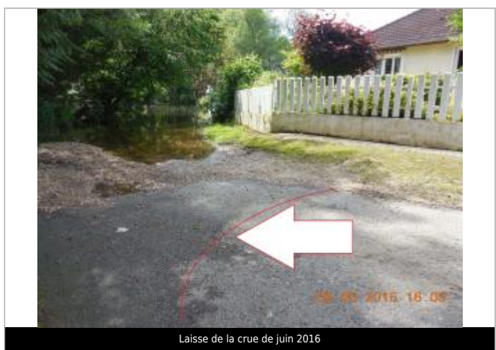
Laisse de la crue de juin 2016

GÉNÉRAL Code : LCI_YEV16_R_18_2 Date de mise à jour : 25/11/2020 Auteur : SPC LCI