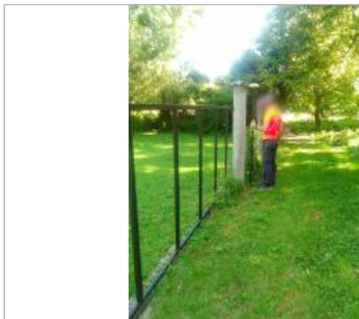
Vue du site en 2016

Coordonnées WGS84 : X: 2.14359200 / Y: 47.19638800