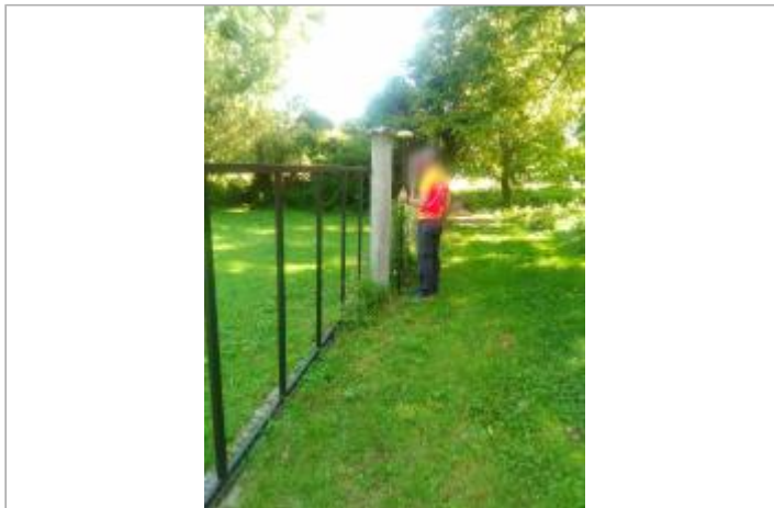
Vue du site en 2016