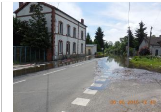
Laisse de la crue de juin 2016

Altitude calculée de l'eau (en m) : 102.574 m