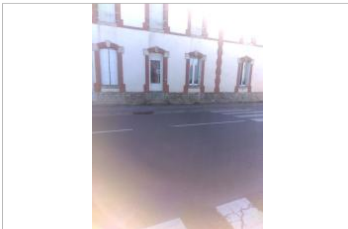
Vue du site en 2016