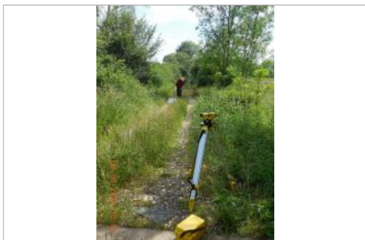
Photographie de la crue de juin 2016