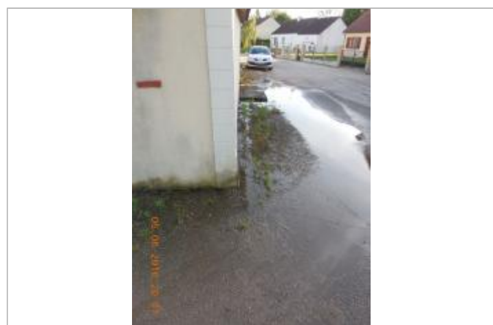
Photographie de la crue de juin 2016

GÉNÉRAL Code : LCI_YEV16_R_15_1 Date de mise à jour : 25/11/2020 Auteur : SPC LCI