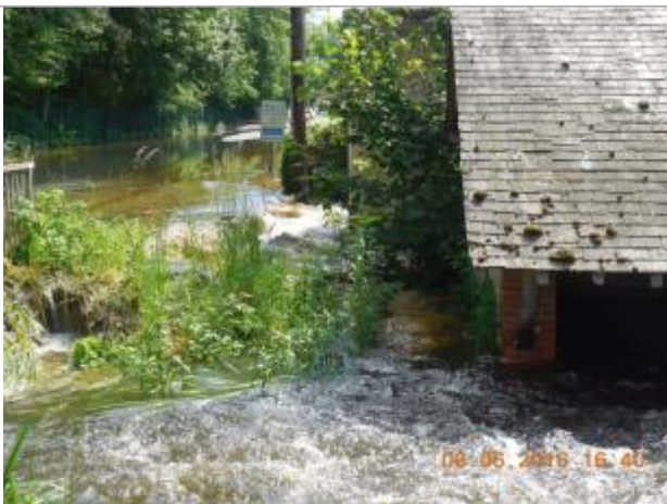
Photographie de la crue de juin 2016

Altitude calculée de l'eau (en m) : 107.6