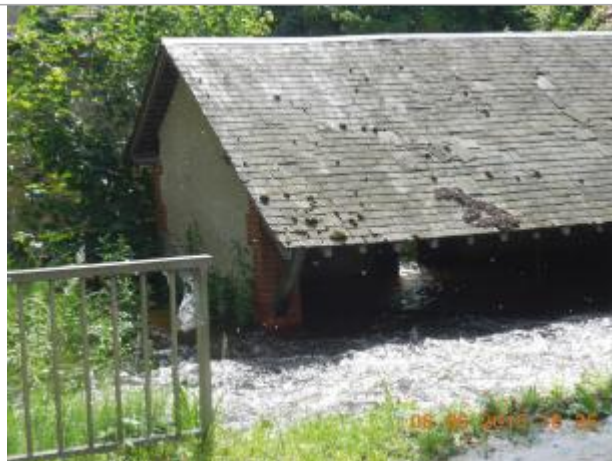
Vue du site en 2016