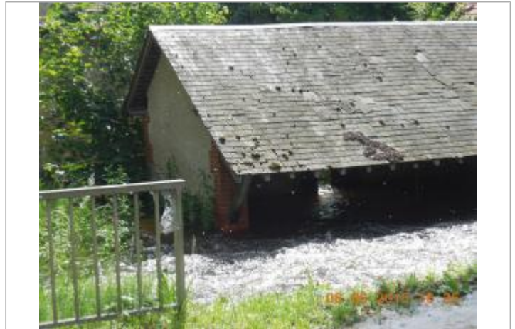
Vue du site en 2016