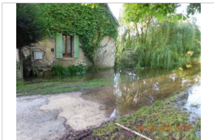
Photographie de la crue de juin 2016

Code : LCI_YEV16_R_12_1 Date de mise à jour : 25/11/2020