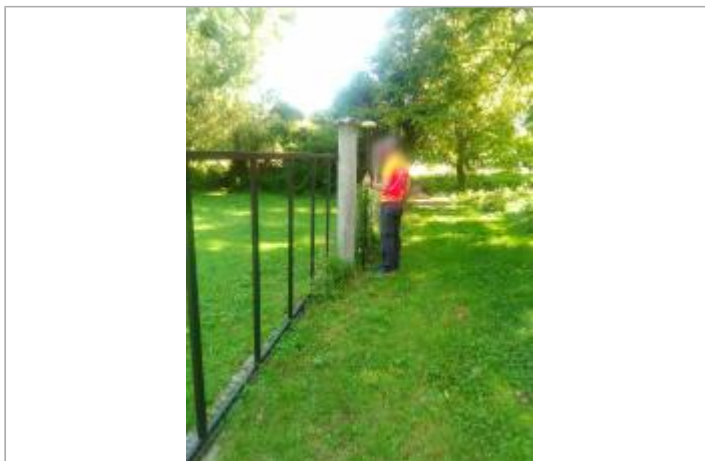
Vue du site en 2016