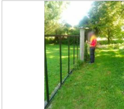
Vue du site en 2016