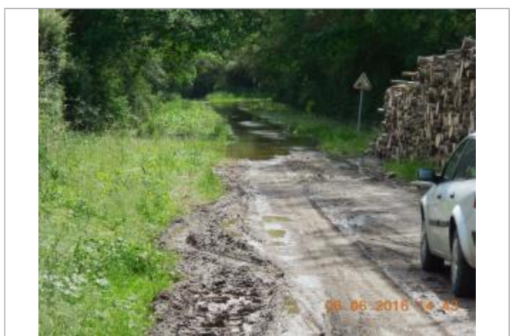
Photographie de la crue de juin 2016

GÉNÉRAL Code : LCI_YEV16_R_9_1 Date de mise à jour : 25/11/2020 Auteur : SPC LCI