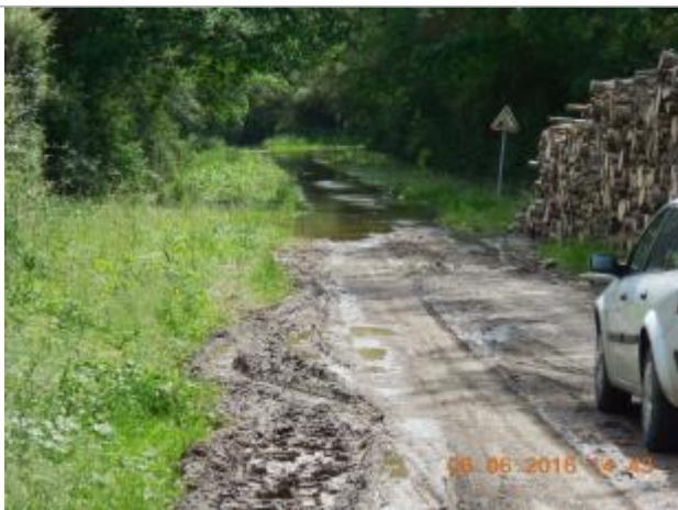
Photographie de la crue de juin 2016

Altitude calculée de l'eau (en m) : 103.582