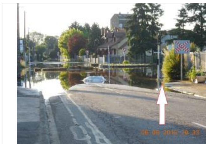
Photographie de la crue de juin 2016