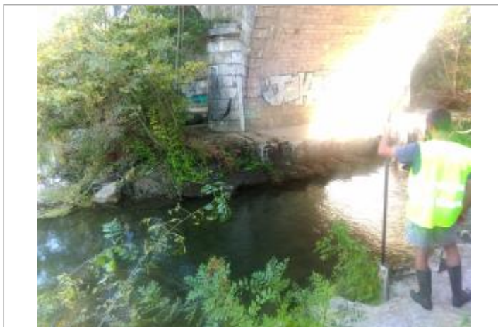
Vue du site en 2016