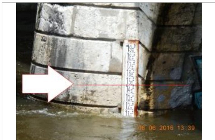
Photographie de la crue de juin 2016

Altitude calculée de l'eau (en m) : 101.489