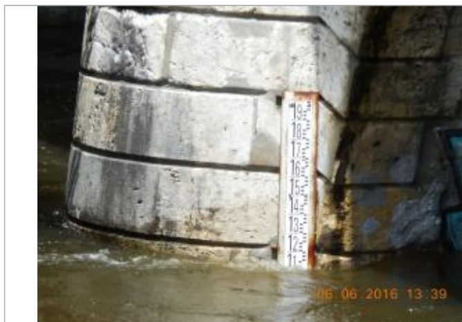
Photographie de la crue de juin 2016

Altitude calculée de l'eau (en m) : 101.109