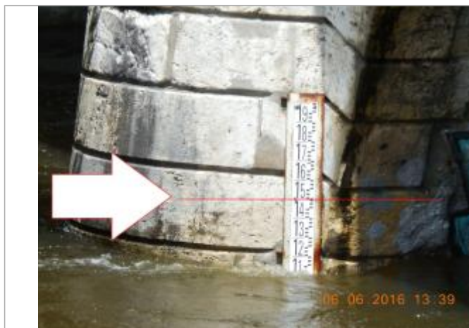
Photographie de la crue de juin 2016

Altitude calculée de l'eau (en m) : 101.489