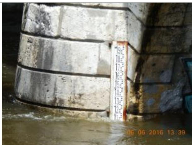
Photographie de la crue de juin 2016

Altitude calculée de l'eau (en m) : 101.109