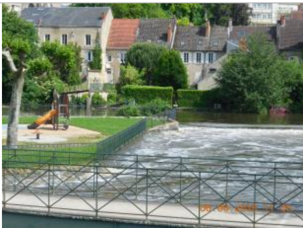
Photographie de la crue de juin 2016

Altitude calculée de l'eau (en m) : 99.717