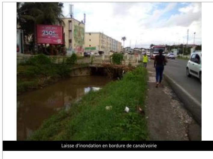
Laisse d'inondation en bordure de canal/voirie