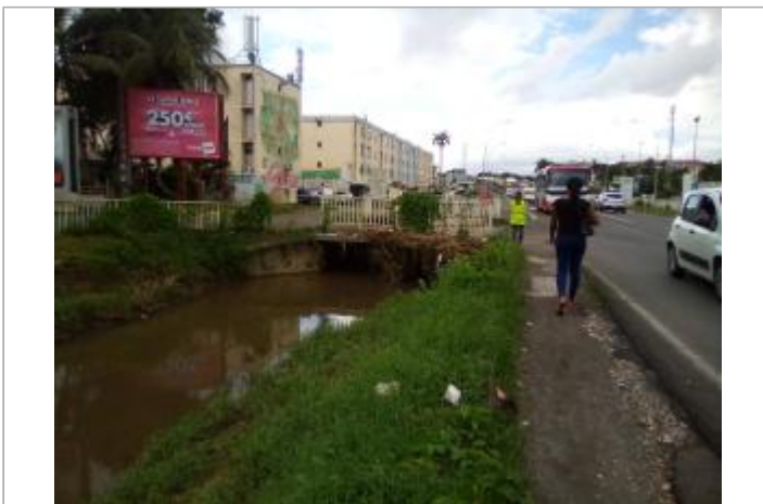
Laisse d'inondation en bordure de canal/voirie