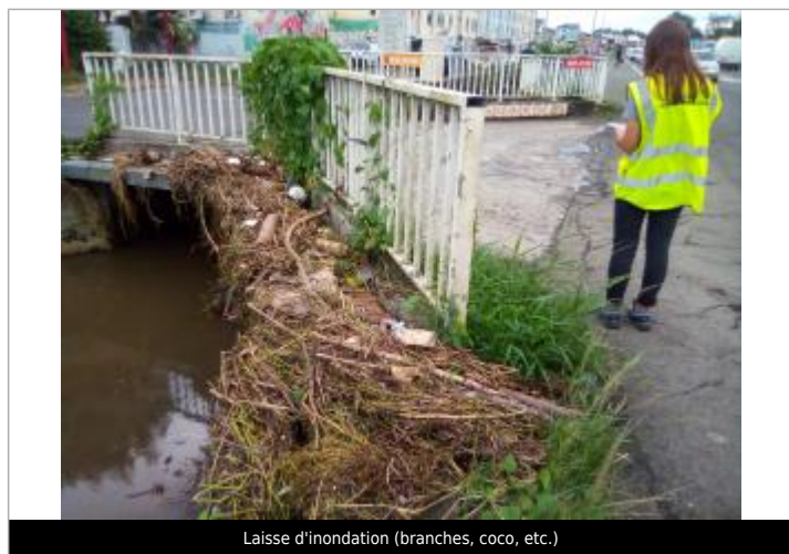
Laisse d'inondation (branches, coco, etc.)

Maximum de l'inondation : Non Visibilité : Oui État du repère : Disparu Pérennité : Aucune