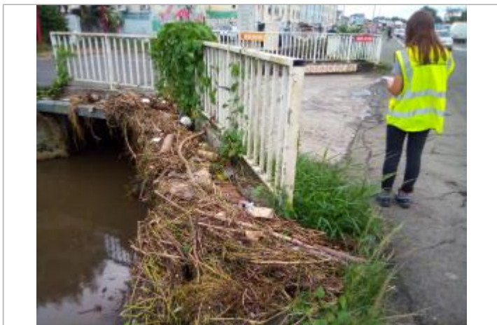
Laisse d'inondation (branches, coco, etc.)

Maximum de l'inondation : Non Visibilité : Oui État du repère : Disparu Pérennité : Aucune