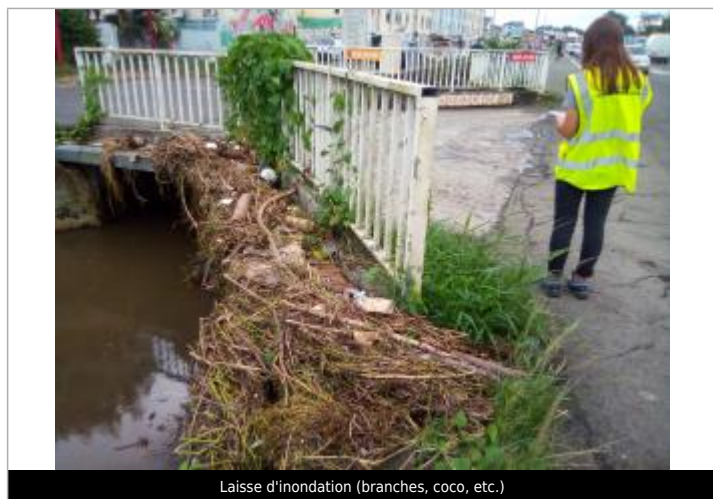
Laisse d'inondation (branches, coco, etc.)

Maximum de l'inondation : Non Visibilité : Oui État du repère : Disparu Pérennité : Aucune