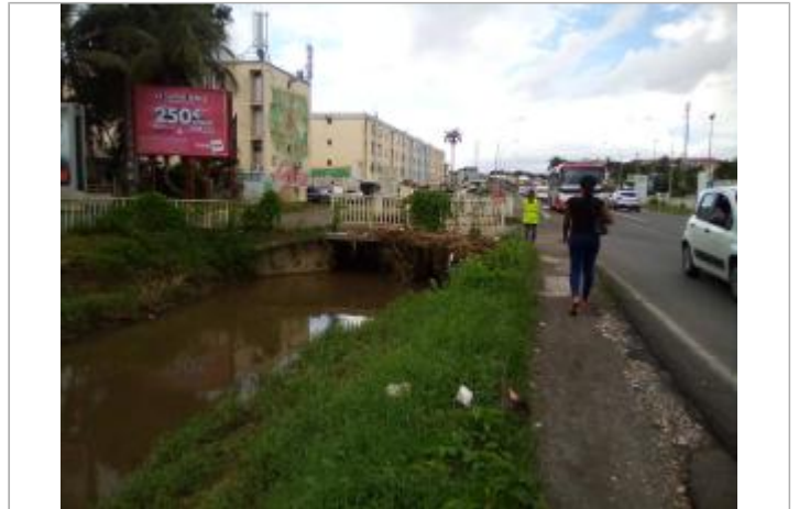
Laisse d'inondation en bordure de canal/voirie