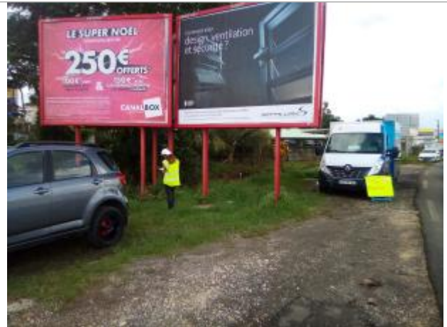
Laisse de crue en pied des panneaux