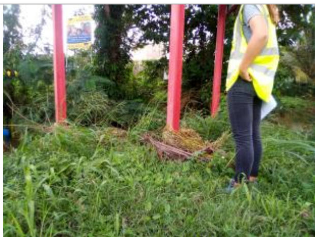
Laisse de crue (branches, coco, etc.)