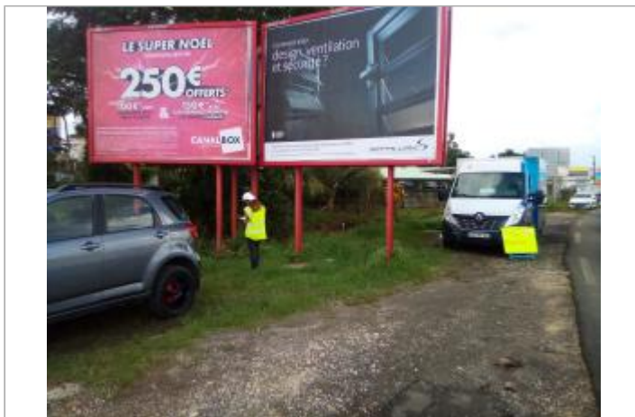
Laisse de crue en pied des panneaux