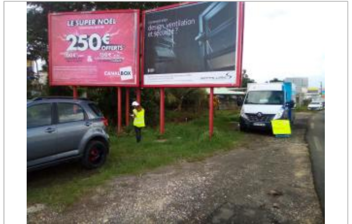
Laisse de crue en pied des panneaux