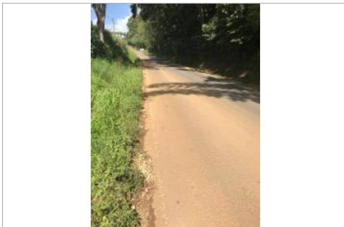
Trace de boue dû au ruissellement pluvial