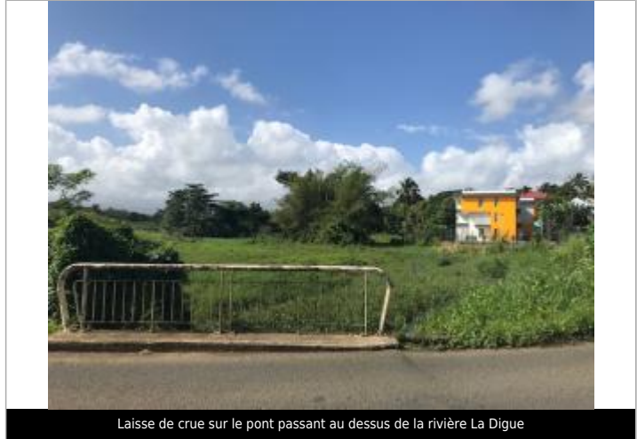
Laisse de crue sur le pont passant au dessus de la rivière La Digue