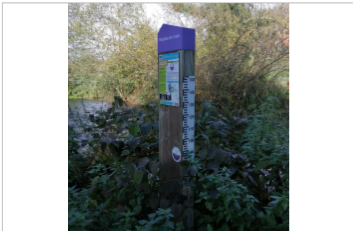
Le totem du repère de crue du passage à gué de Longueville-sur-Scie

Maximum de l'inondation : Oui Visibilité : Oui État du repère : Bon Pérennité : Longue