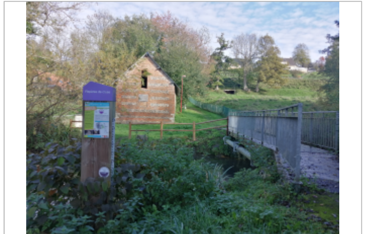
Dans l'impasse à gué