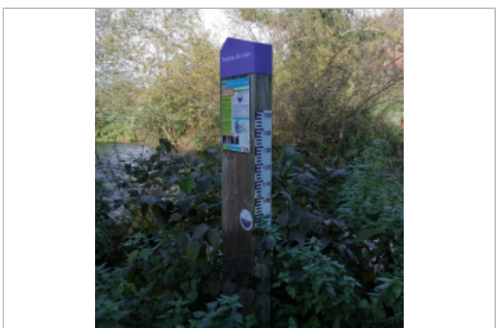
Le totem du repère de crue du passage à gué de Longueville-sur-Scie

MARQUE Maximum de l'inondation : Oui Visibilité : Oui État du repère : Bon Pérennité : Longue