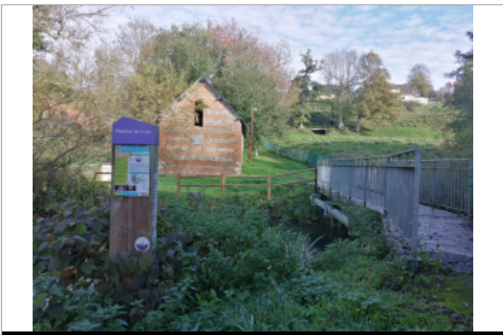
Dans l'impasse à gué

GÉOLOCALISATION Coordonnées WGS84 : X: 1.10771700 / Y: 49.79551300 Coordonnées RGF93 (Lambert 93) X: 563672.27 / Y: 6967925.36 Coordonnées RGF93 (ETRS89) : X: 1.107717 / Y: 49.795513 Code Hydro: G3100600 Rive de référence: