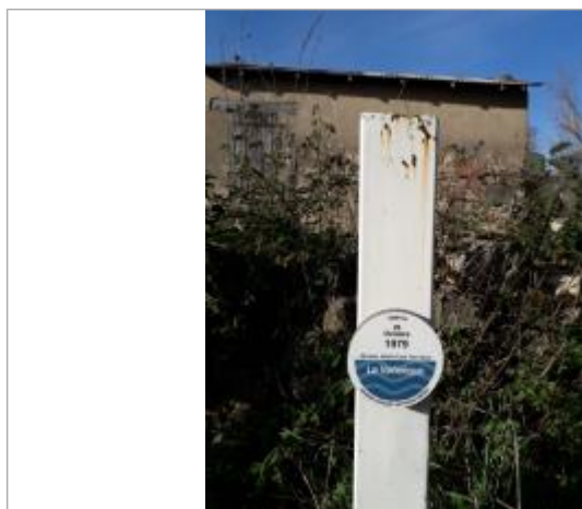
Repère de la crue du Verlenque du 26 octobre 1979, matérialisé sur poteau métallique