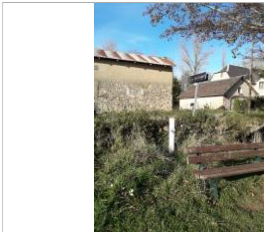
Le verlenque aux Calquières - rue Emile Zola

Coordonnées WGS84 : X: 3.06279028 / Y: 44.31499060