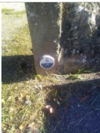
Repère de la crue du 3 mars 1930