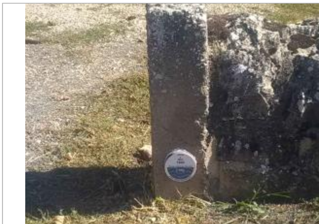
L'Olip au Cayrol - Recoules Prévinquières