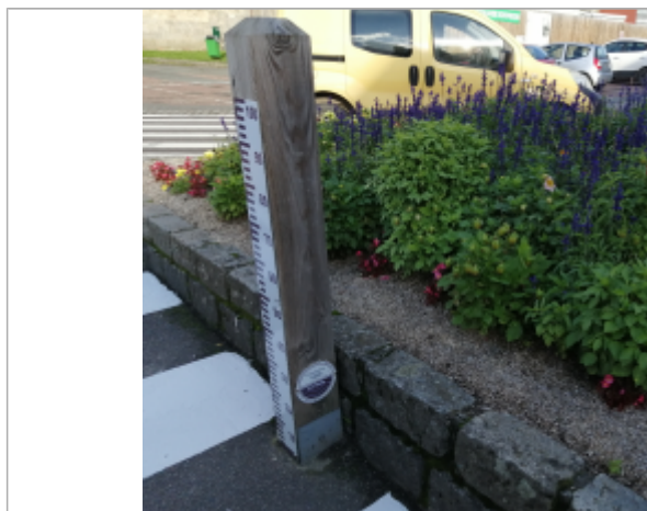
Le totem du repère de crue de la Place du Général de Gaulle à Auffay