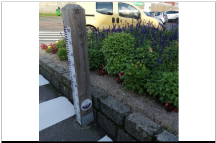
Le totem du repère de crue de la Place du Général de Gaulle à Auffay

MARQUE Maximum de l'inondation : Oui Visibilité : Oui État du repère : Bon Pérennité : Longue