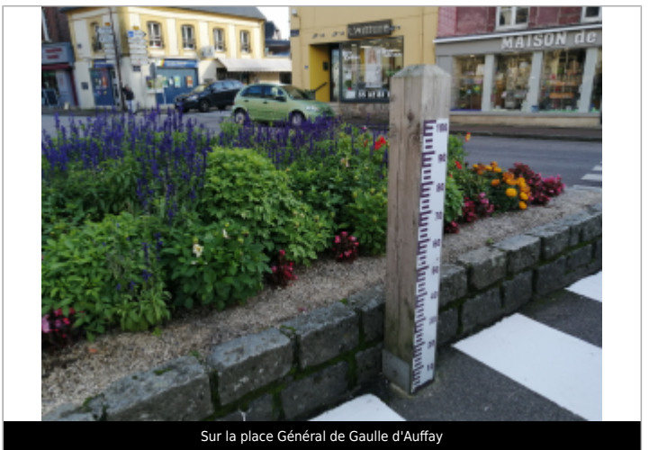
Sur la place Général de Gaulle d'Auffay

GÉOLOCALISATION Coordonnées WGS84 : X: 1.09976700 / Y: 49.71916700 Coordonnées RGF93 (Lambert 93) X: 562895.17 / Y: 6959444.29 Coordonnées RGF93 (ETRS89) : X: 1.099767 / Y: 49.719167 Code Hydro: G3100600 Rive de référence: