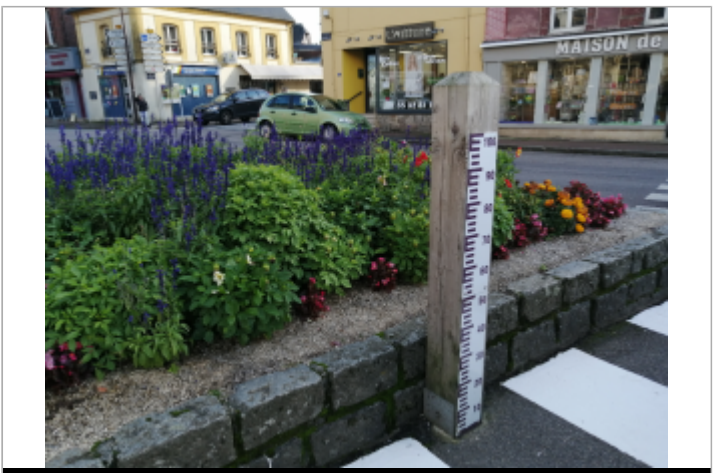
Sur la place Général de Gaulle d'Auffay

GÉOLOCALISATION Coordonnées WGS84 : X: 1.09976700 / Y: 49.71916700 Coordonnées RGF93 (Lambert 93) X: 562895.17 / Y: 6959444.29 Coordonnées RGF93 (ETRS89) : X: 1.099767 / Y: 49.719167 Code Hydro: G3100600 Rive de référence: