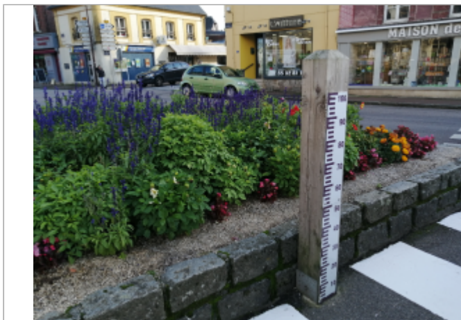
Sur la place Général de Gaulle d'Auffay