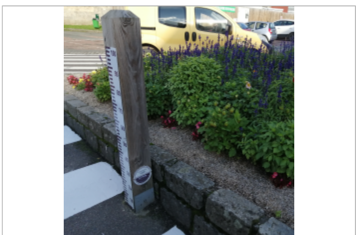
Le totem du repère de crue de la Place du Général de Gaulle à Auffay

MARQUE Maximum de l'inondation : Oui Visibilité : Oui État du repère : Bon Pérennité : Longue