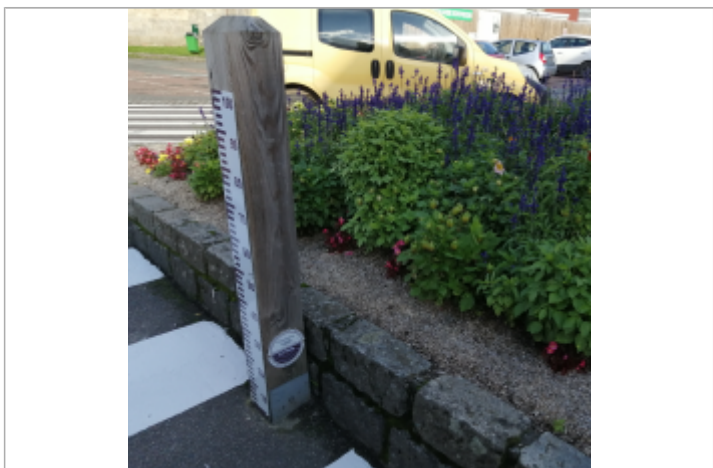
Le totem du repère de crue de la Place du Général de Gaulle à Auffay

MARQUE Maximum de l'inondation : Oui Visibilité : Oui État du repère : Bon Pérennité : Longue