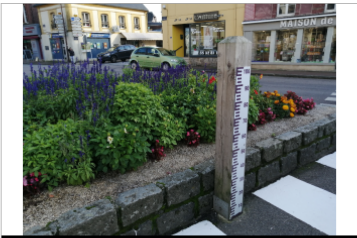
Sur la place Général de Gaulle d'Auffay

GÉOLOCALISATION Coordonnées WGS84 : X: 1.09976700 / Y: 49.71916700 Coordonnées RGF93 (Lambert 93) X: 562895.17 / Y: 6959444.29 Coordonnées RGF93 (ETRS89) : X: 1.099767 / Y: 49.719167 Code Hydro: G3100600 Rive de référence: